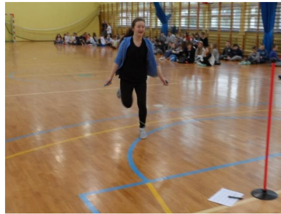
Konkurencje sportowe wymagały też wysiłku umysłowego.