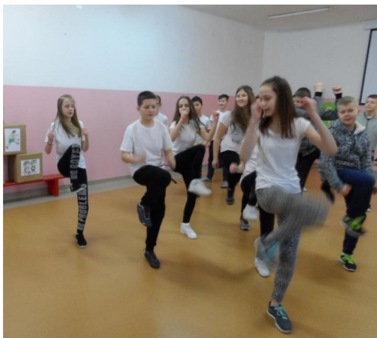
„Wyginaj śmiało ciało” w wykonaniu klasy VI b.

Wiele pozytywnych emocji i uśmiechu na twarzy wywołała prezentacja przygotowanego wcześniej układu ruchowego (ćwiczeń lub tańca) do wybranej przez siebie muzyki. Do zadania tego wszystkie klasy przygotowały się bardzo dobrze. Uczniowie pokazali naprawdę wspaniałe tańce i ćwiczenia gimnastyczne. Działanie to, noszące tytuł „Wyginaj śmiało ciało”, było tym punktem naszego projektu, które i uczniom i nauczycielom podobało się najbardziej (co potwierdza ankieta przeprowadzona na koniec Dni Przeciwdziałania Przemocy i Agresji).