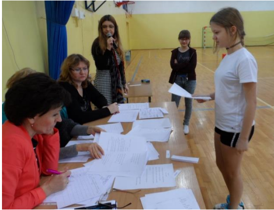
Gimnastyka dla języka