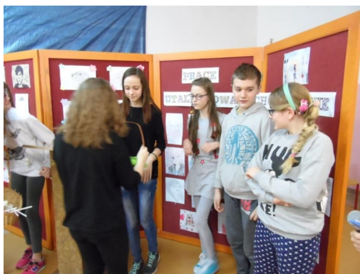
Każdy uczeń, który pochwalił się swoim talentem, dostał drobny upominek.