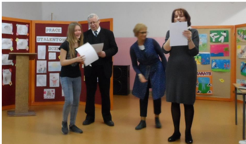
Nagrody kupione zostały z funduszy Samorządu Uczniowskiego.

Tego dnia ogłoszono wyniki konkursów, które odbyły się w trakcie Szkolnych Dni Przeciwdziałania Przemocy i Agresji. Laureaci otrzymali dyplomy i nagrody.