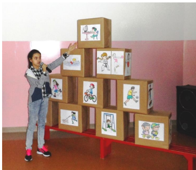
Uczniowie z kl. IV b zaprezentowali w czasie przedstawienie PIRAMIDĘ AKTYWNOŚCI FIZYCZNEJ.

Wiele pozytywnych emocji i uśmiechu na twarzy wywołała prezentacja przygotowanego wcześniej układu ruchowego (ćwiczeń lub tańca) do wybranej przez siebie muzyki. Do zadania tego wszystkie klasy przygotowały się bardzo dobrze. Uczniowie pokazali naprawdę wspaniałe tańce i ćwiczenia gimnastyczne. Działanie to, noszące tytuł „Wyginaj śmiało ciało”, było tym punktem naszego projektu, które i uczniom i nauczycielom podobało się najbardziej (co potwierdza ankieta przeprowadzona na koniec Dni Przeciwdziałania Przemocy i Agresji).