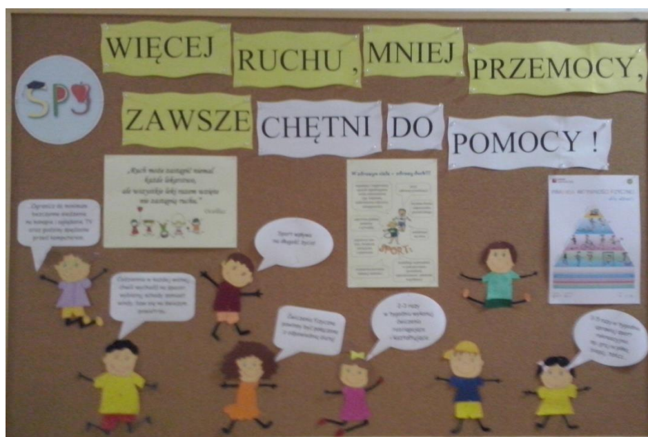
Gazetka na korytarzu szkolnym promowała aktywność fizyczną.

Nasza szkoła od wielu lat podejmuje różne działania na rzecz edukacji zdrowotnej. Jednym z nich są Szkolne Dni Przeciwdziałania Przemocy i Agresji. Tegoroczny projekt zrealizowaliśmy w dniach 14 – 21 marca 2016 r. i nosił nazwę „Więcej ruchu, mniej przemocy, zawsze chętni do pomocy”. Jego nadrzędnym celem było utwierdzanie uczniów i ich rodziców w przekonaniu, że dobra zabawa, ruch, sport są tak samo ważne, jak zdobywanie wiedzy, a pomaganie daje naprawdę dużo radości.