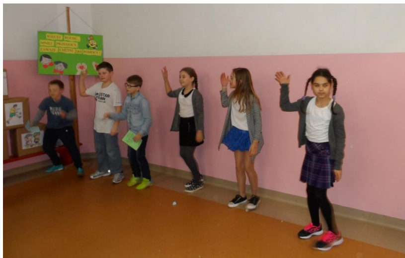
Uczniowie klasy IV b zachęcali wszystkich do udziału w roztańczonej przerwie.

Wielką popularnością cieszyły się roztańczone przerwy, które w tym roku prowadziły uczennice z klasy IV b. na drugiej długiej przerwie przy muzyce gimnastykowali się i uczniowie i nauczyciele. W czasie trwania ćwiczeń dziewczyny z klasy V b rozdawały, przygotowane przez panią Lewoc, ulotki o sporcie i jego pozytywnym wpływie na zdrowie człowieka.